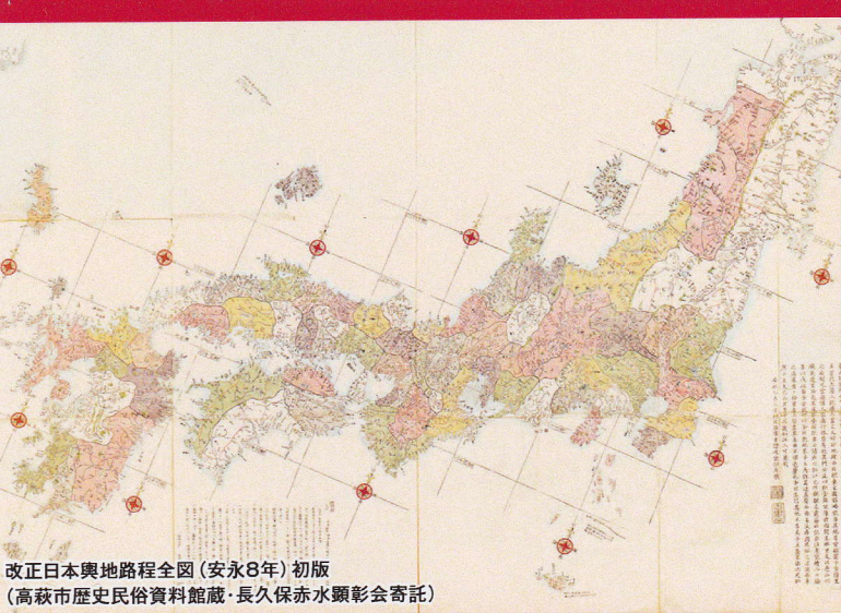
改正日本輿地路程全図(安永8年)初版 (高萩市歴史民俗資料館蔵・長久保赤水顕彰会寄託)