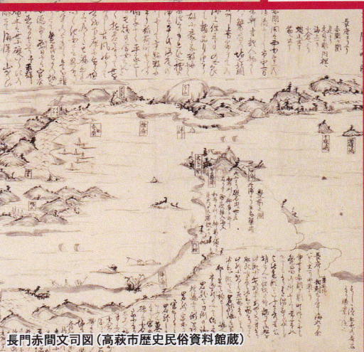
長門赤間文司図(高萩市歴史民俗資料館蔵)