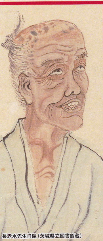
長赤水先生肖像