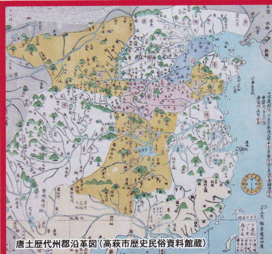
唐土歴代州郡沿革図(高萩市歴史民俗資料館蔵)