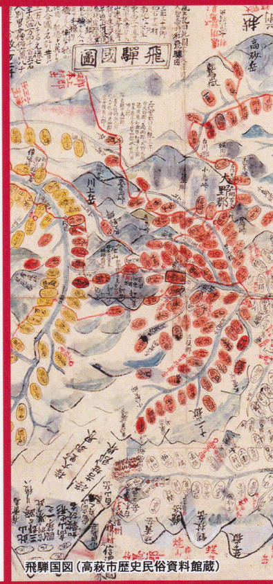
飛騨国図(高萩市歴史民俗資料館蔵)