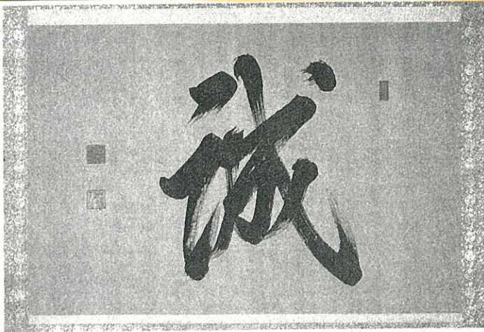
一橋徳川家関係資料から「書『誠』徳川慶喜 筆」

国の文化審議会は、県所有の「一橋徳川家関係資料」と、高萩市所有の「長久保赤水関係資料」を国の重要文化財(美術工芸品)に指定するよう文部科学相に答申した。県内の重要文化財(同)は47件(うち国宝2件)になる見通し。関係者からは喜びと期待の声が聞かれた。