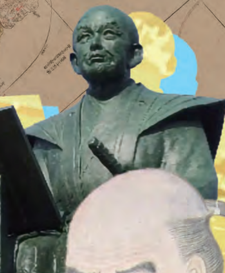
ながくぼ あかし 長久保赤水 1717-1801

日本を代表する江戸時代の儒学者、民衆・地理学者、農政学者。水戸藩第6代藩主徳川治保公の侍講侍読(お側に仕える先生)