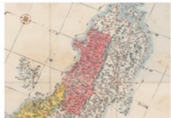
奥羽山脈 陸奥・出羽国を隔てた脊梁山脈