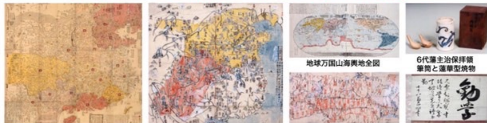
大清広輿図 天明5年(1785)