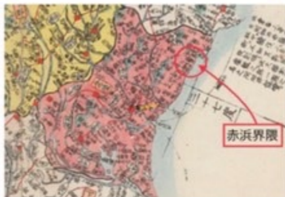
長久保赤水の誕生地(赤浜村)