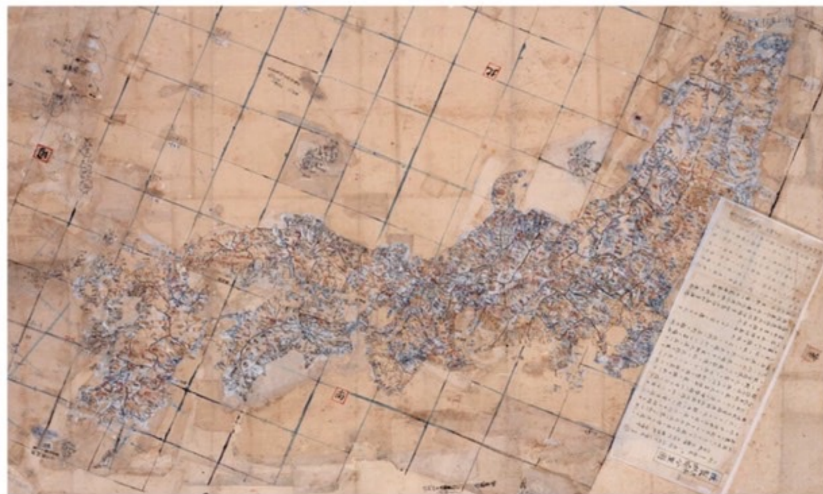
「改製日本分里図」明和5年(1768) 赤水図の原図、竹島も記載された最古の日本地図