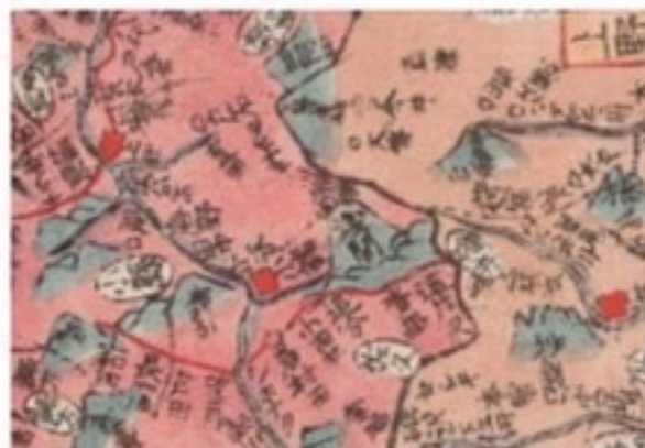
防災情報を記した浅間山の噴煙