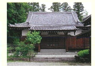
智観寺 (飯能市中山520)