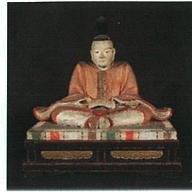
中山信吉 木像(智観寺 所蔵) ※会場には、茨城県高萩市教育委員会所蔵の複製を展示いたします。

中世期の中山氏の起こりから、中山信吉の出世や功績、その一族の紹介を解説パネルにて3部構成にして分かりやすく展示します。智観寺所蔵の木碑原寸大タペストリーなど、信吉の生い立ちから水戸徳川に尽くしたことなどを始め、信吉の人柄も伺えるよう展示を行います。