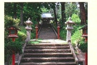
加治神社 (飯能市中山716)