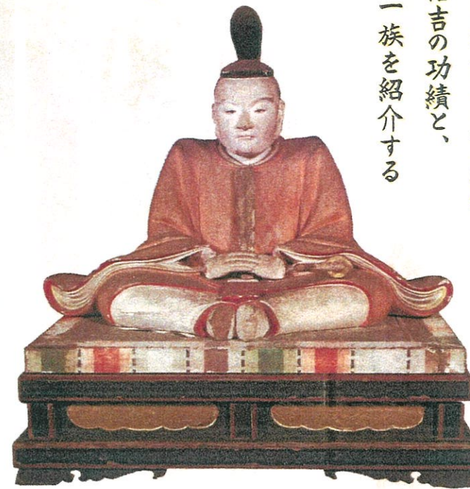
中山信吉木像 江戸時代 智観寺 所蔵