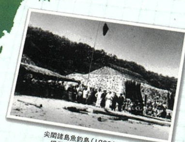
尖閣諸島魚釣島(1908年頃)