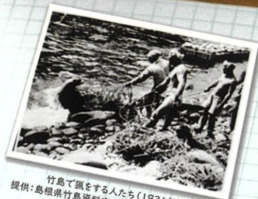
竹島で餌をする人たち(1934年)