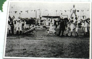
歯舞群島 多楽小学校の大運動会(1937年)