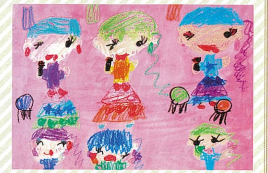
「アイドル」 田山 ひらり