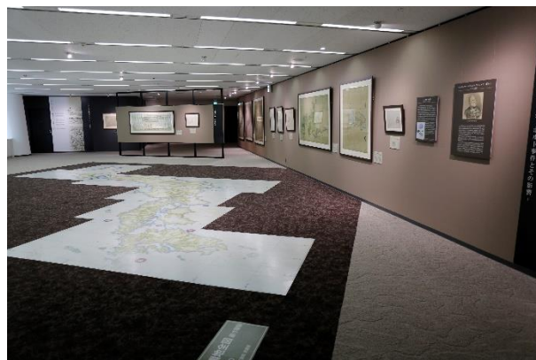
▲第2章 伊能図の出現と近代日本