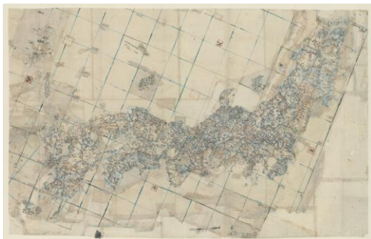
▲「改製日本分里図(輿地路程図草稿)」 長久保赤水 明和5年(1768年) 高萩市歴史民俗資料館 所蔵

地図の製作工程に着目し、長久保赤水が地図作りの際に集めた資料や、伊能忠敬らが使った測量器具・製図道具、それらをもとに完成した「赤水図」と「伊能図」の比較などを、約30点の地図や資料で紹介します。