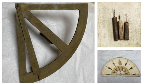
▲「測量器具 小象限儀・針・方位紙」 江戸時代後期 松浦史料博物館 所蔵

赤水が約17年の歳月をかけて製作した図。地形や地名の修正や、和紙を何枚も重ねて書き直した跡が残され、考証を繰り返した赤水の苦悩が見て取れる。