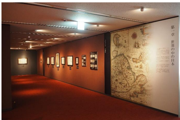
▲第1章 世界の中の日本